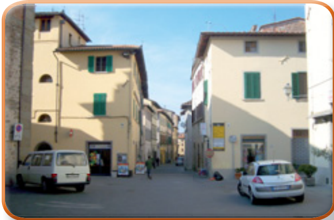
L'ingresso principale nel rione di PORTA ROMANA

È il quartiere tradizionale di Sansepolcro. Come del resto ogni città ha il suo. Il quartiere che dà la connotazione "doc" e l'identificazione precisa a chi lo abita, ma soprattutto a chi in esso è nato o comunque cresciuto, attribuendogli le prerogative di "indigeno". In genere, è anche il quartiere più antico. Tradotto all'atto pratico, come il romano "vero" è quello di Trastevere e l'aretino verace è quello di Colcitrone, così il biturgense autentico è quello che proviene da Porta Romana, da sempre ribattezzata giustamente come la parte più "antica" di una Sansepolcro che ha 4 vecchie porte ed è divisa in 4 rioni, ma che fondamentalmente fa capo ai 2 grandi versanti nei quali storicamente si riconosce: quello più salottiero e animato di Porta Fiorentina (anche se il "salotto" necessita di un accurato restyling) e quello più classico di Porta Romana, bello da vedere ma più avulso dalle abitudini della mondanità e dai flussi di passeggio. Una zona più