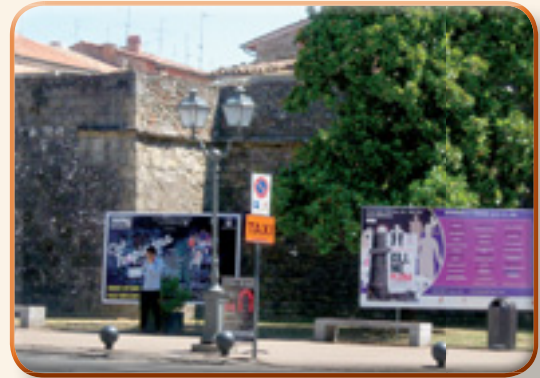
Un angolo di PORTA FIORENTINA