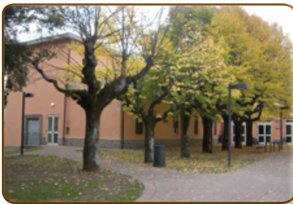
La struttura dell'OPERA PIA MUZI-BETTI

di fisioterapia, quello di animazione e quello alberghiero. Un'ala dell'Opera Pia Muzi-Betti è infine in fase di ristrutturazione per la realizzazione di 12 posti letto di Comunità Alloggio per disabili adulti, grazie anche al contributo offerto dalla Fondazione Internazionale Lions (Lcif) con il progetto "Mai soli". La nuova area sarà realizzata nel rispetto dei più moderni standard strutturali e i lavori dovrebbero essere consegnati entro il prossimo dicembre.