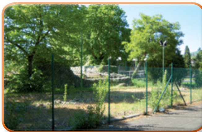
Un angolo "eloquente" dell'area del CAMPACCIO

cattedrale si è perso un qualcosa di veramente interessante. Solo così l'antico quartiere potrà sperare di riavere la propria dignità. E dire che l'unica società rionale presente e sopravvissuta a Sansepolcro è proprio quella di Porta Romana, che si adopera in favore di essa con le serate gastronomiche durante le rievocazioni di settembre e si distingue nel periodo natalizio con la realizzazione dello stupendo presepe nella chiesa di Santa Marta (ogni anno uno scenario e un messaggio nuovo per attirare le visite) e con la festa del 6 gennaio, quando i contradaioli danno il benvenuto ufficiale ai nati nelle famiglie del rione. Con riferimento al presepe, possiamo affermare che effettivamente – durante le festività, con via XX Settembre addobbata a festa come del resto nei giorni del Palio della Balestra – Porta Romana registra una maggiore vitalità e di conseguenza anche il suo tratto di corso è più frequentato. E' la dimostrazione del fatto che le iniziative di qualità sono destinate ad avere successo. Magari – questo sì – sarebbe opportuno che anche i giovani impinguassero i ranghi della società rionale, perché questa bella realtà associativa ha il limite di essere animata dal solito e ristretto gruppo di fedelissimi. E se questi a un certo punto dichiarassero di non farcela più? Si verrebbe a perdere un pezzo cardine di quel patrimonio importante che è il volontariato cittadino.