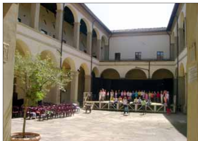
Il chiostro dell'ex convento di Santa Chiara, sede "storica" della scuola elementare "Edmondo De Amicis"