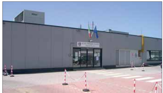
La sede provvisoria della scuola elementare "De Amicis" al Centro Valtiberino