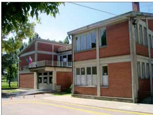
Scuola elementare "Collodi" a Porta Romana